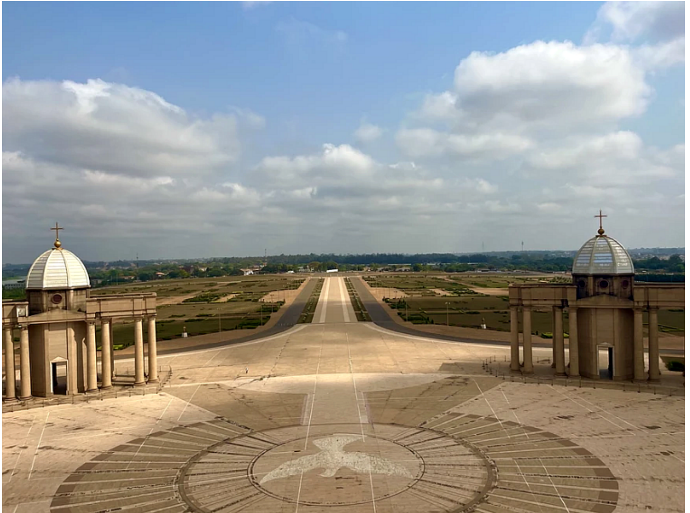
Basilique Notre-Dame de la Paix, a templom előtere

Levezetésként, mielőtt elkezdnénk párhuzamokat keresni mondjuk Felcsút és Yamoussoukro, az új főváros között lássuk a három látnivaló közül a továbbiakat a wannabe fővárosból: