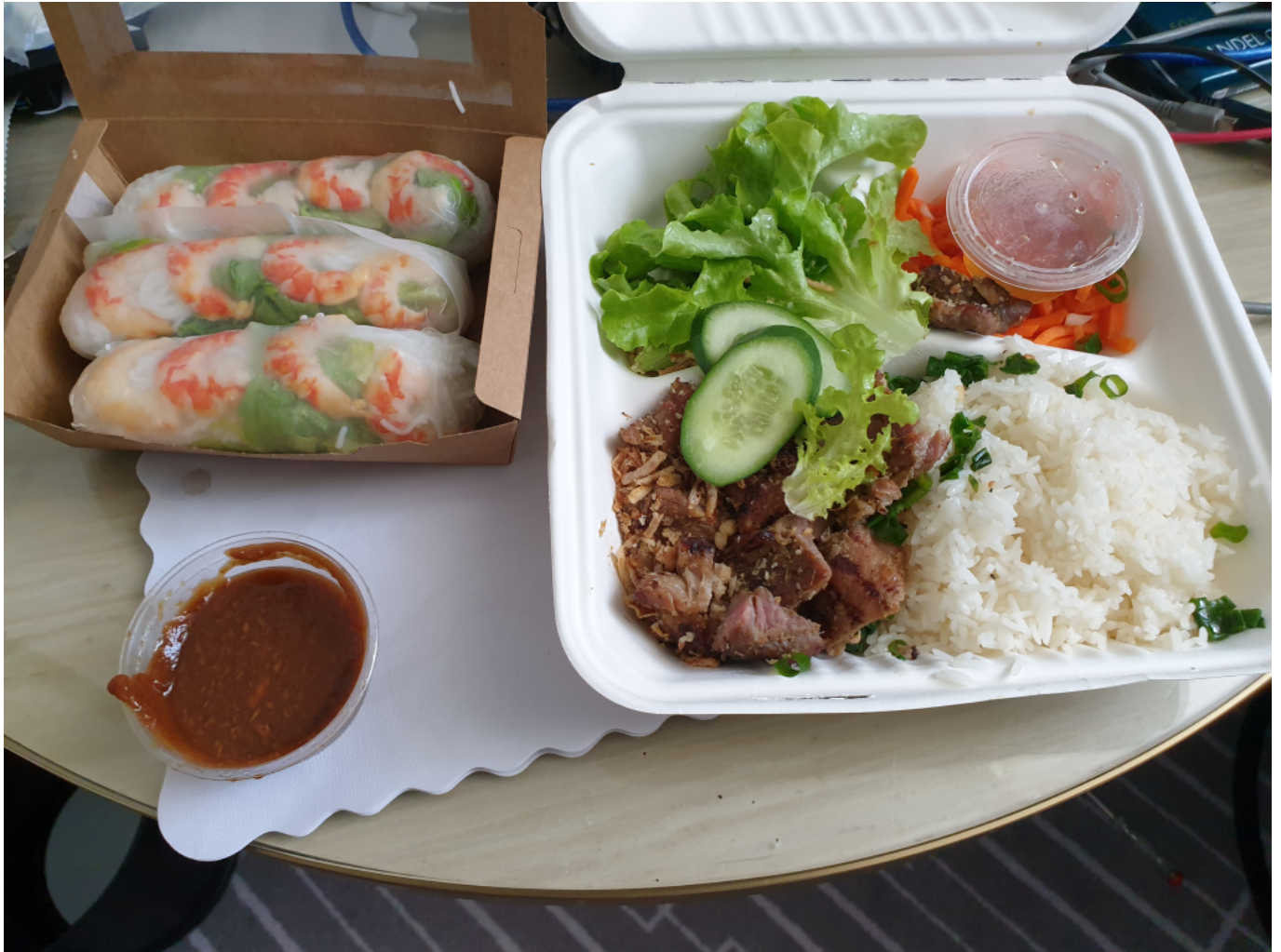
A két kép közül az egyik az az étel, amit a hotelben adnak. Nem ez.