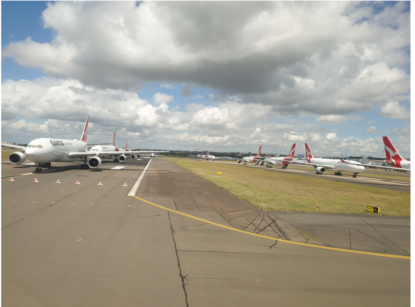
A kényszervárakozásra ítélt repülőgépek hosszú sora Sydney repülőterén