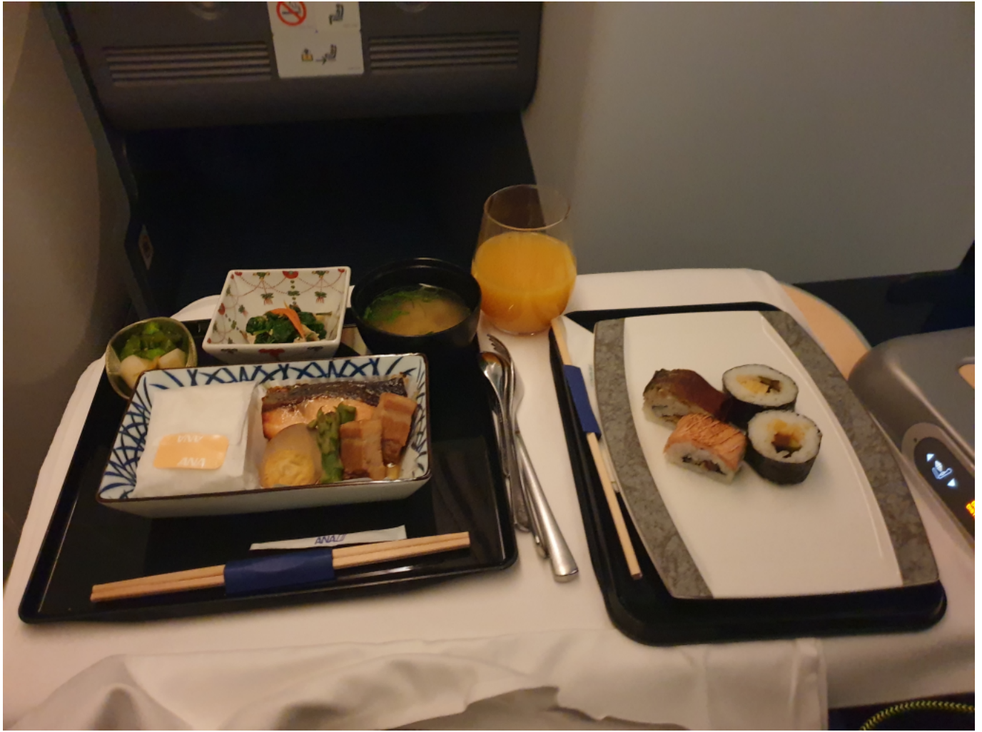
Japán vacsi a fedélzeten.