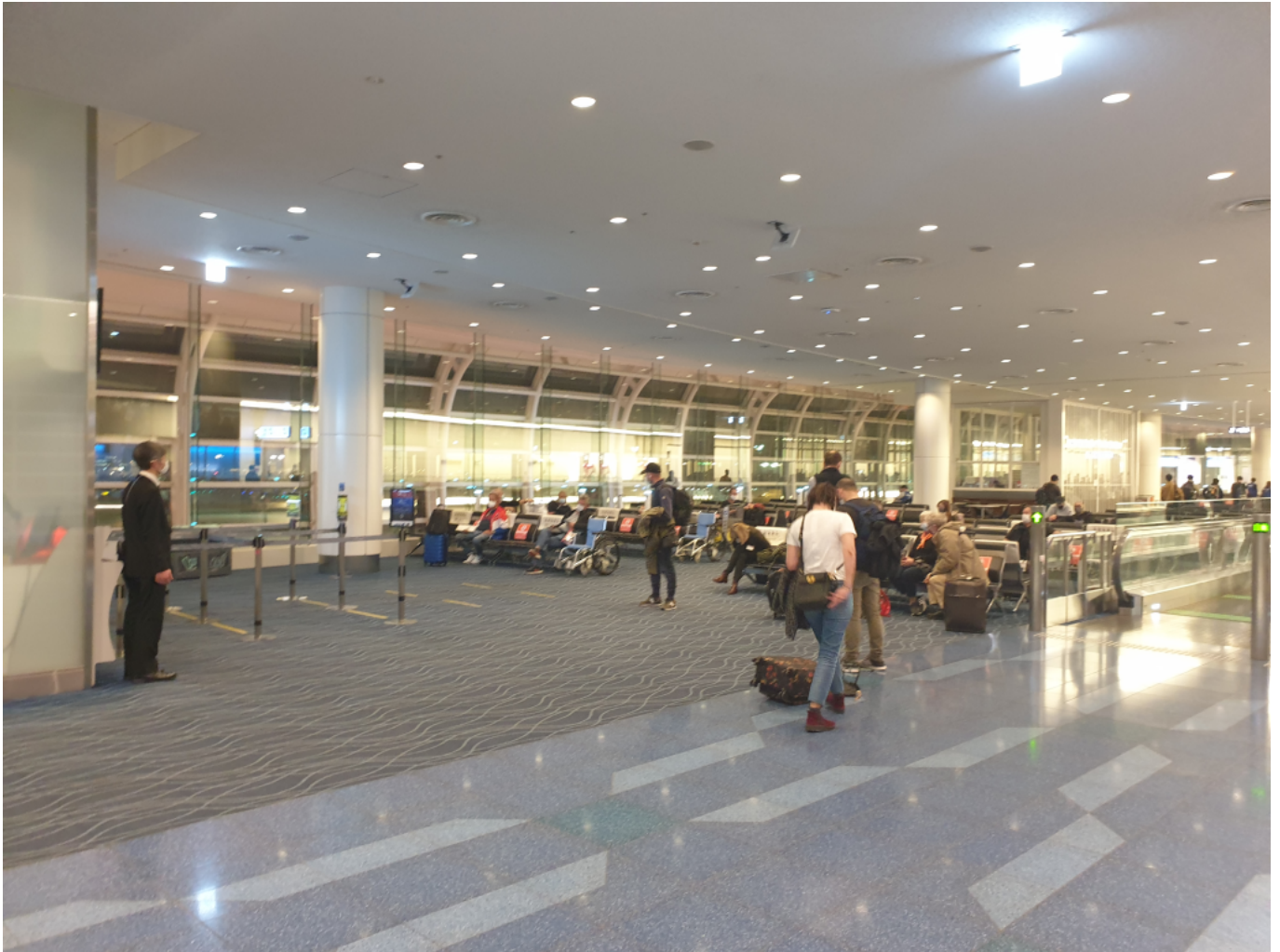
A becsekkolás Tokióban. Ahhoz képest, hogy a gép 270 férőhelyes, olyan nagy tülekedés nincs a beszállásnál.