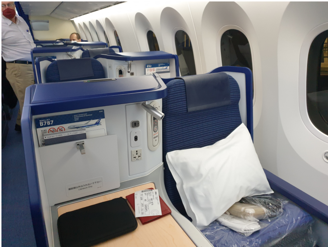
Az ülés a vadonaúj gépen