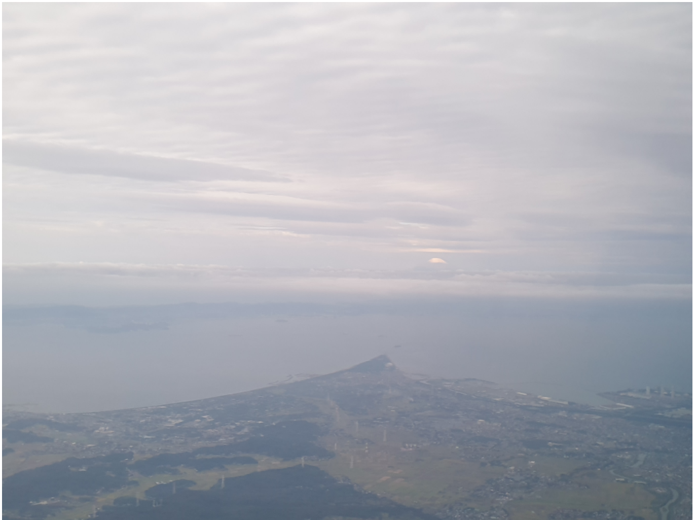
A Fuji-yama a ködben