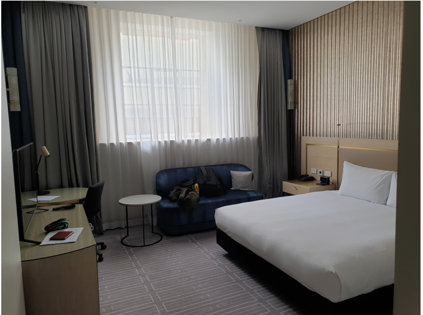
Karantén a Raddison hotelben, hotelszoba

Internet inkább nincs mint van, és ha van is, rendkívül halovány. A szomszéd hotelben egy fokkal jobb a net, oda úgy sikerül csatlakoznom, hogy a routeremet egy kinaiból jött áthajtogatott kaja-alufóliatáblával felpimpeltem. A reggelit, ebédet és vacsorát a szobaajtó elé teszik le, a szememet is ide kell kipakolni. Sajnos, itt is az a szokás, hogy csak a vacsora meleg étel, ami viszonylag kiadós, a reggeli minimüzli kondenztejjel és a déli szikkadt szendvics valamivel töltve gyakorlatilag felejtős. Mondjuk a vacsora is, mire ideér, kihűl, de a többi étkezésnél ez szerencsére nem számít, azok eleve hidegételek. Egyedüli pozitív dolog, hogy adnak felvágott gyümölcsöt is az ebédhez, de a többit (szégyen vagy gyalázat, és rettenetesen utálok ilyesmit tenni) teszem ki az ajtó elé. Tényleg mindenevő vagyok, igénytelen állat a magam módján, de ez a szikkadt szendvics dolog - na ez nem megy. Ráadásul innivalónak van az a napi kettő, egydecis valami gyümölcslé, vagy a csapvíz - persze, értem én, hogy ennek is lehet örülni, de emlékeztetek, ez két heti 3000 dollárért van így.