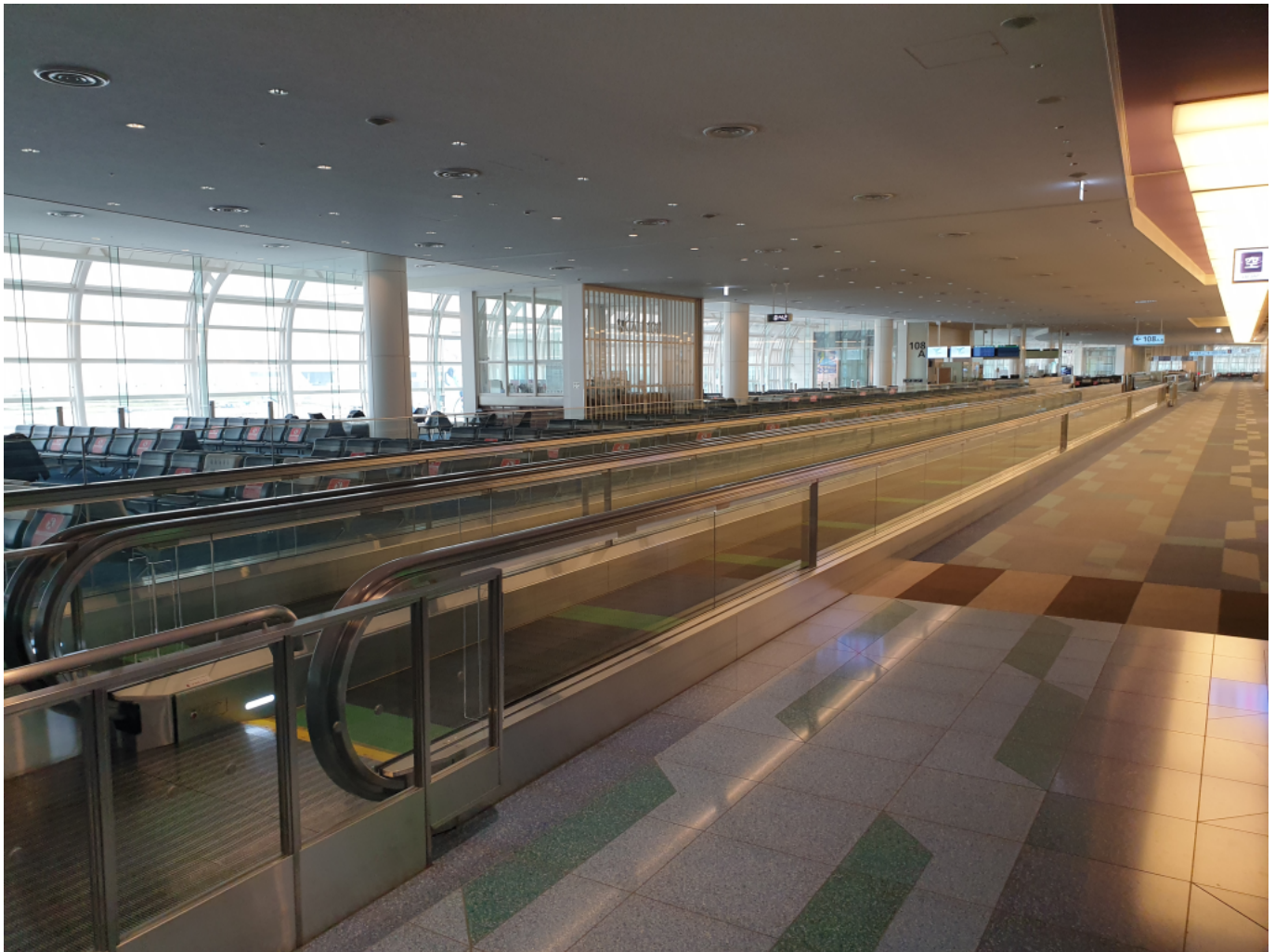
A teljesen üres Haneda repülőtér

Este az emberek elkezdtek gyülekezni a Sydney-be tartó gépnél, de tömegnek aztán semmi nyoma nem volt. A pultnál a kezelők japánul és angolul folyamatosan ismételték, hogy a 14 nap karantén kötelező a belépés után – ez van, ezt már eddig is tudtam. A gép ugyanaz a típus volt, mint az előző, kényelmes és a személyzet előzékeny, de a feszültség már azért érzékelhető volt. A gép érkezésekor kattintottam pár képet a városról, de érzem, hogy nem fogom a kedvenc helyeim a világon kollekcióba beletenni. Alapvetően már a repülőgépen is meglehetősen fenyegetően szólította meg az utasokat a bevándorlásiak kisfilmje, hogy a koszos cipőket, magokat meg élelmiszert is tilos bevinni az országba, és ez ügyben nincs „ sorry ”. A fogadtatás még ehhez képest is hűvös volt, katonák és rendőrök sora fogadott minket, és gyorsan buszokra is tereltek mindenkit, amik rendőri felvezetés mellett gurultak be a városba.