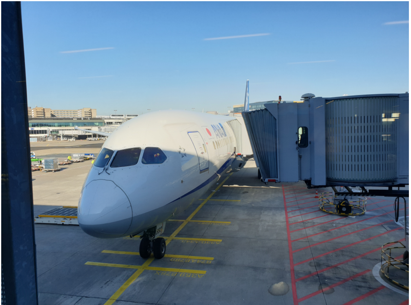
Az ANA 787-900-asa Frankfurtban

A biztonság kedvéért egy nappal korábban elutaztam vonattal Frankfurtba, ugyanis a jól ismerem a Német Vasutat, és tud az meglepetésekkel szolgálni (legutóbb pont itt, Frankfurtban akadtam el egy estére). Az éjszakát egy közeli hotelben töltöttem, jó korán kimentem a reptérre, hogy nehogy valami kellemetlen meglepetés érjen. A check-in sem volt még nyitva, ezért csatangoltam egyet a meglehetősen kihalt reptéren.