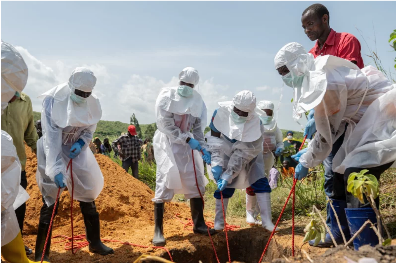
Vöröskereszt munkatársai egy ebolás áldozatot temetnek a Rwampara temetőben, Rwampara városában, Kongóban, 2026. május 23-án.

Az ember ritkán fertőződik meg közvetlenül denevérektől. Gyakori, hogy a denevérek által megrágott, vírusos gyümölcsöket vagy a földre hulló váladékukat más erdei állatok – csimpánzok, gorillák, antilopok, sündisznók – fogyasztják el, amelyek viszont már súlyosan megbetegednek a vírustól.