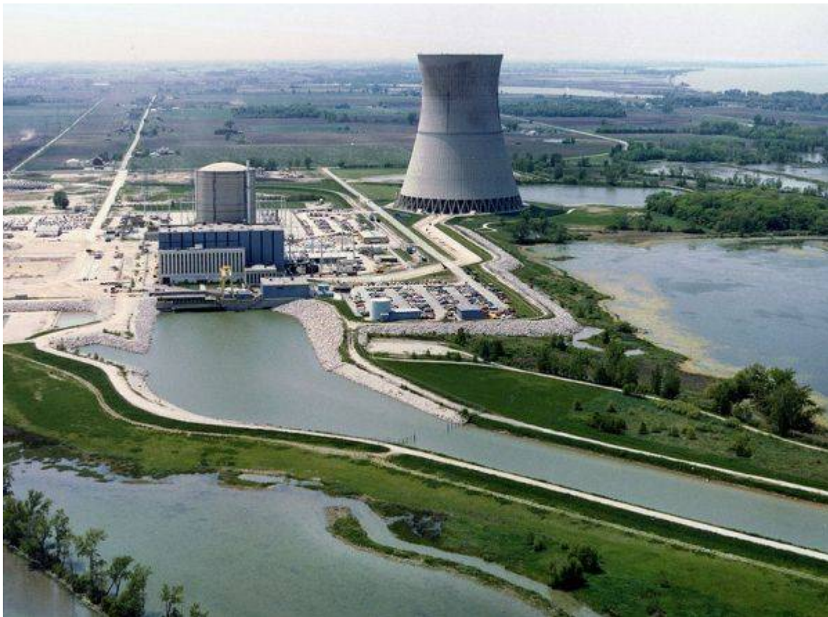
Davis-Besse atomerőmű, Ohio

Az erőművet (Davis Besse Nuclear Power Station) az ohio-i Erie-tó partján, nem messze Oak Harbor-tól kezdték meg építeni 1971-ben. Hat évvel az első kapavágás után 925 MW teljesítményű reaktora üzembe állt, és csatolták a hálózatra.